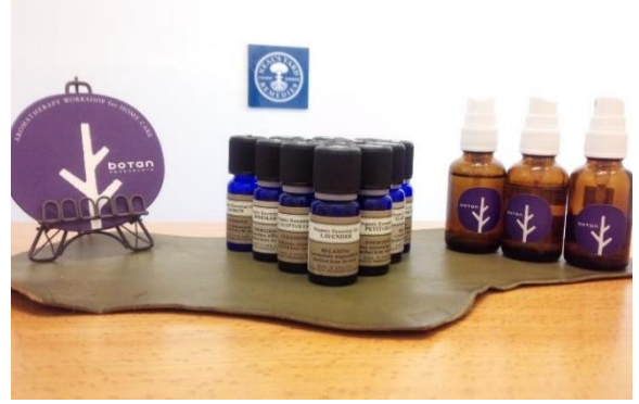
オリジナルエアーフレッシュナー作り