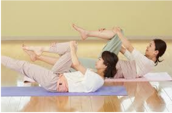
マットピラティス